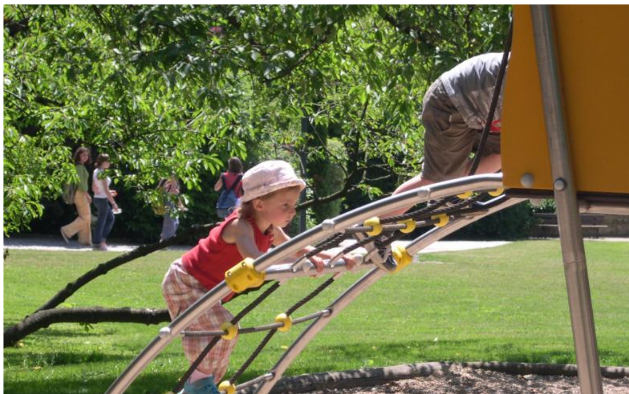
Jeux du parc du Haut-Château