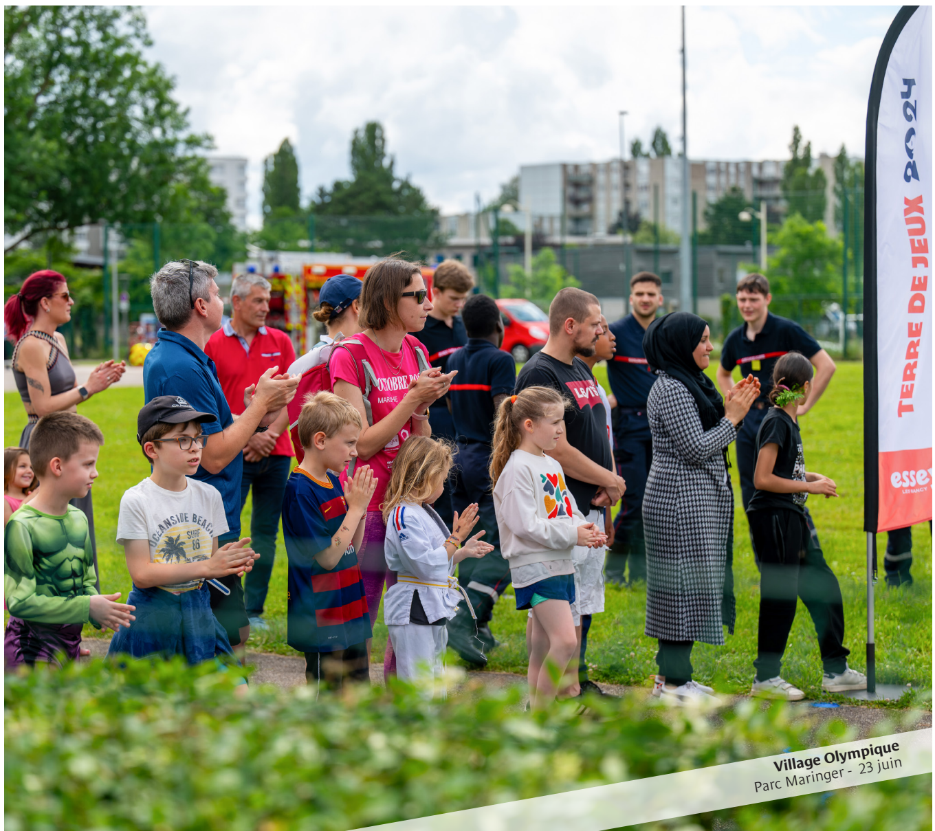
Village Olympique Parc Maringer - 23 juin