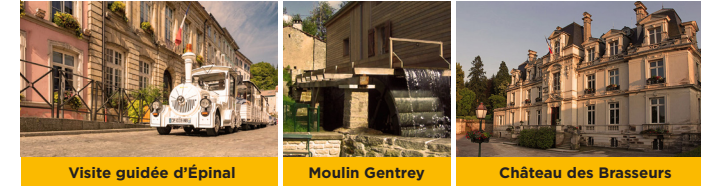
Visite guidée d'Épinal